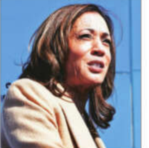
Kamala Harris has raised $615 million since President Joe Biden announced he would stand aside on July 21

Harris has raised $615 million since President Joe Biden announced he would stand aside on July 21. Her haul includes money raised for her campaign, the Democratic National Committee and state parties. The Democratic presidential nominee had $404